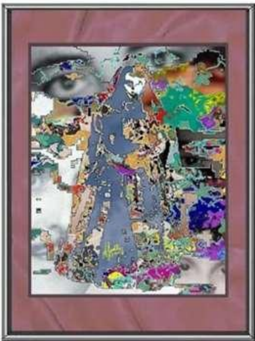
San Juan Oleo sobre lienzo 204x205 cms Colección del artista