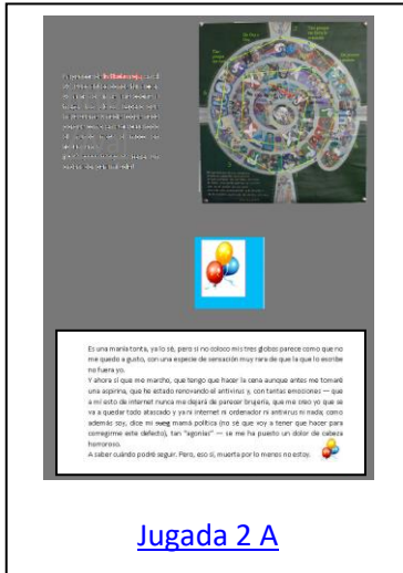
Jugada 2 A