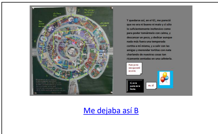
Me dejaba así B