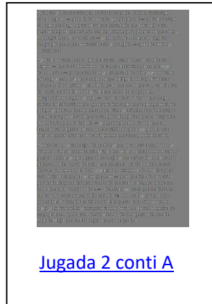
Jugada 2 conti A